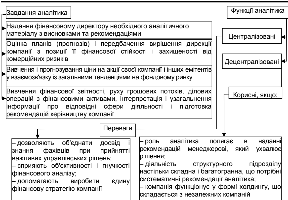
Рис. 4. Завдання і функції аналітика (розроблено на основі [2, с. 78-79])

Аналізуючи дані рис. 4 підтвердимо, вагомість професійного розвитку аналітика, адже саме від знання методики аналізу всіх напрямів господарської діяльності підприємства та від вміння визначити, правильно розрахувати та інтерпретувати необхідні коефіцієнти, залежить управління об'єктами аналізу відповідного напрямку, яке на основі даних аналітика здійснює фінансовий директор. Тому, аналітик повинен не лише вміти здійснювати шаблонні розрахунки, але й чітко розуміти їх значення для господарської діяльності підприємства.